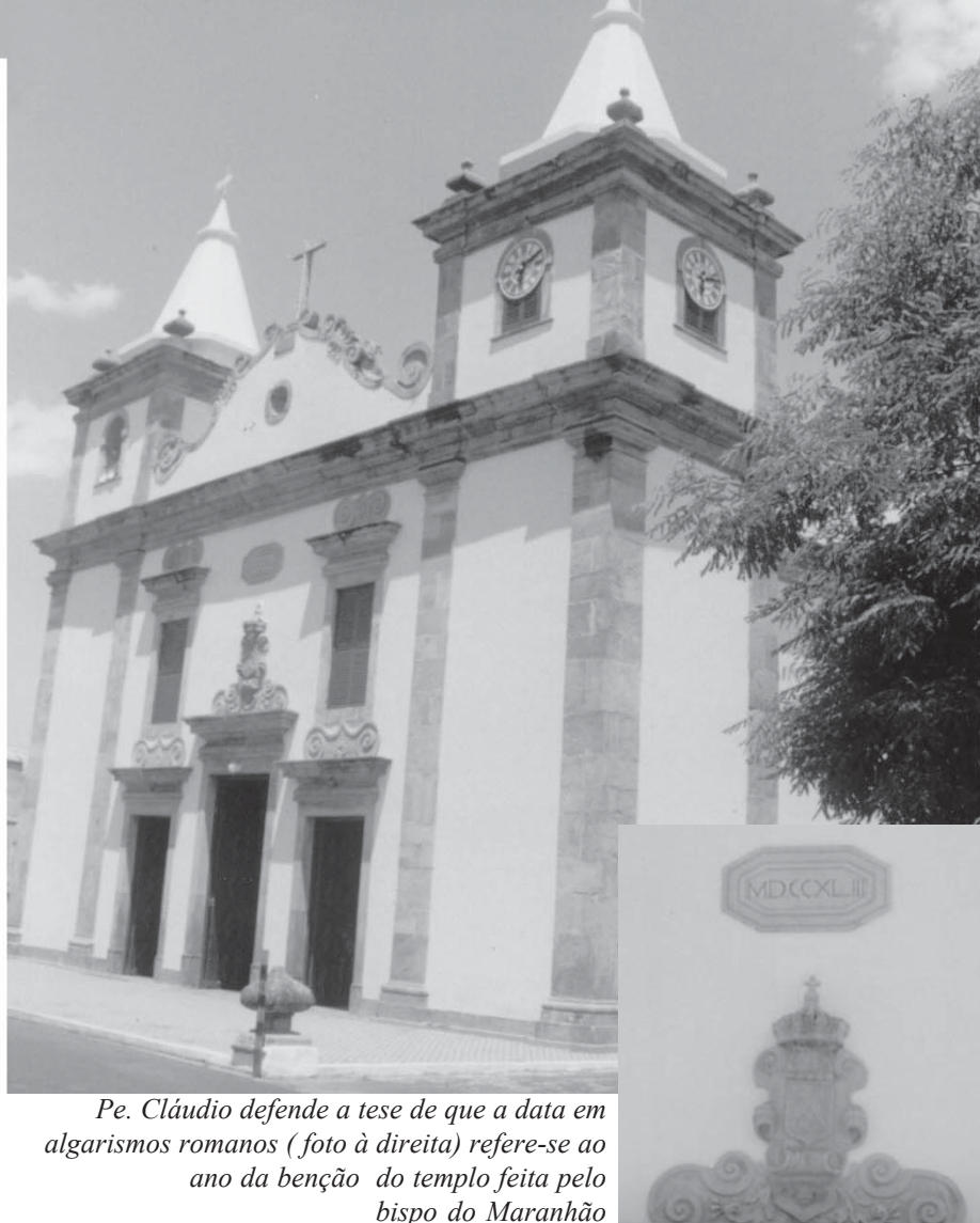
Pe. Cláudio defende a tese de que a data em algarismos romanos (foto à direita) refere-se ao ano da benção do templo feita pelo bispo do Maranhão

Nesse conjunto de incertezas, o que se pode afirmar, sem dúvida, é que a