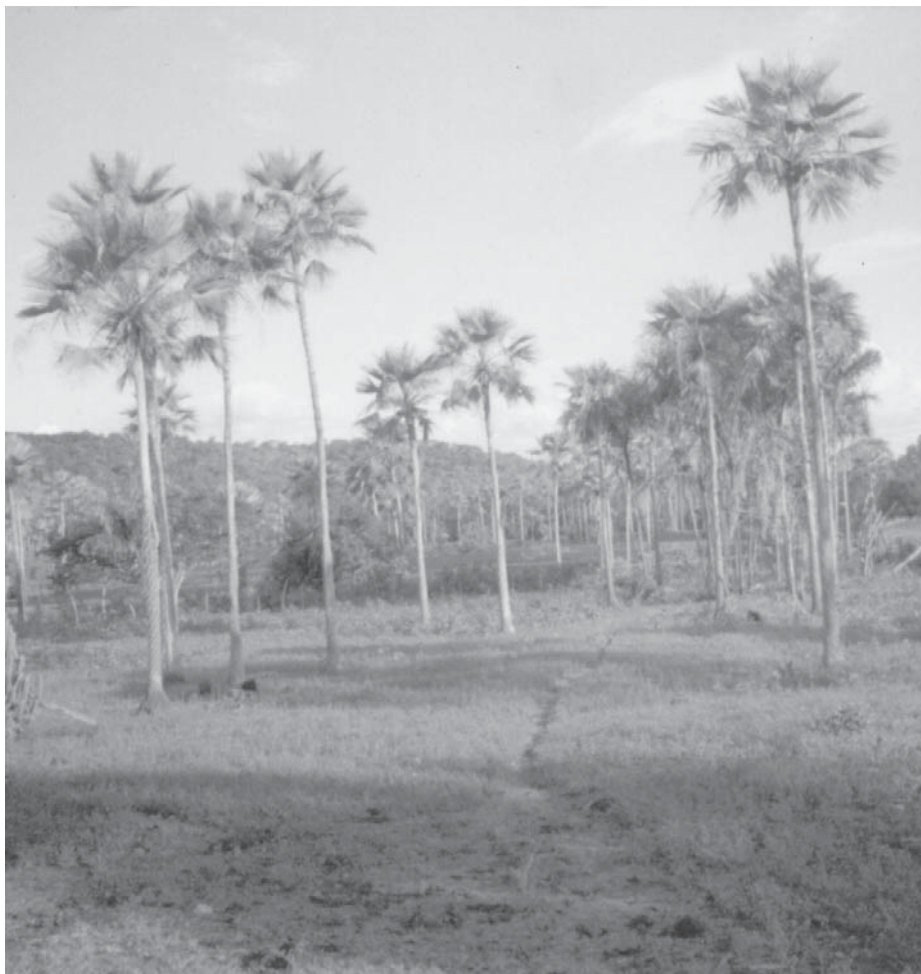
A carnaúba é uma palmeira típica da região e dela tudo se aproveita