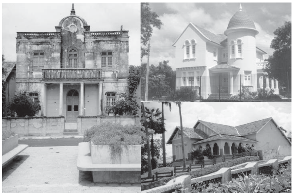
O ecletismo se tornou o estilo mais marcante na cidade, visto que estas construções foram erguidas num período de grande prosperidade

Do mesmo estilo encontram-se o mercado público, algumas unidades escolares, a atual casa paroquial, a antiga usina de energia, entre outras construções públicas e institucionais. Neste período as edificações eram projetadas por arquitetos de outras cidades e até mesmo de outros estados como um arquiteto