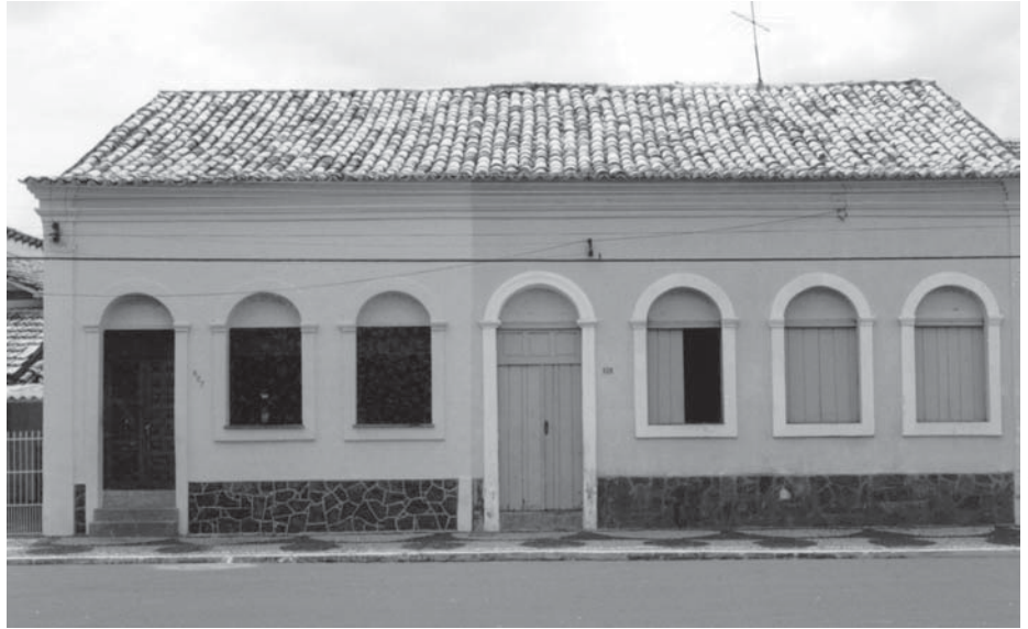
A coroa portuguesa determinava o traçado das ruas e o alinhamento das construções

A maioria das edificações no entorno da praça Irmãos Dantas e da Igreja de Nossa Senhora do Carmo têm sua construção marcada por dois momentos distintos: antes e durante o ciclo econômico da carnaúba. As casas mais antigas, do século XIX, eram de criadores de gado, de uso quase que exclusivamente residencial. São rústicas, invariavelmente de um pavimento e obedecem a tipologia da morada inteira, meia-morada e porta-e-janela, geralmente geminadas, apresentando uma planta baixa em forma de “C”, “L” ou retangular, respectivamente. As fachadas são marcadas com elementos do barroco colonial como cimalha, pilastras, barrado, beira-sobeira, com portas e janelas emolduradas e com arcos plenos. A construção dessas residências, assim como da igreja matriz, era determinada de acordo com as cartas-régias vindas de Portugal, que especificavam o tipo de planta-baixa